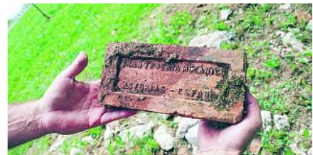
restos de Patrimonio industrial. Pese a que hace más de treinta años que cerró la fábrica de pólvora Santa Bárbara, aún pueden encontrarse en la finca algunos vestigios de su primitiva actividad industrial. franco torre

El gran pulmón del concejo de Siero está en Lugones. Con sus 30,74 hectáreas, la finca de La Acebera, también conocida como «La Cebera» o «Santa Bárbara», es la mayor zona verde de carácter público del municipio y en ella se alternan imponentes zonas boscosas con otras ajardinadas. Todas ellas grandes desconocidas incluso para muchos de los vecinos del concejo.